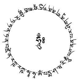
念慈蓮師金剛盔甲護輪

ཨོཾ་པདྨ་ཤལ་རི་རྩྭ་ལྷ་མོ་པར་གྲོག་པོ། རྣམ་མཁུན་རྩེ་མཚོ་ལྷ་མོ་རི་ཏྲ་ཏྲ་ཏྲ་ཏྲ་ལྷ་མོ་རྩེ་མཚོ།